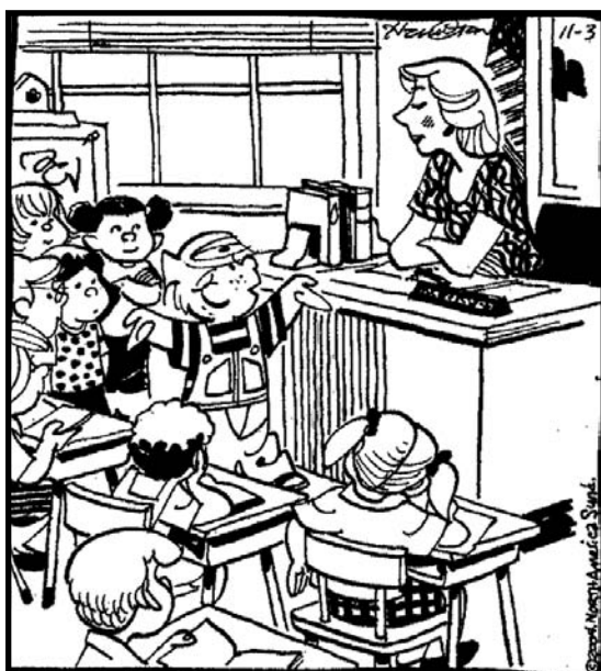
— Hank Ketcham, “Dennis the Menace” (adapted)

33 In Spanish, write a story about the situation shown in the picture below. It must be a story relating to the picture, not a description of the picture. Do not write a dialogue.